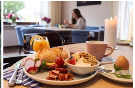
Frühstücks-Lounge als Treffpunkt

Download per hinterlegtem Hyperlink oder unter http://www.primo-pr.com/bildarchiv/downloads.php?category=65